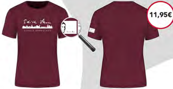
Basic T-Shirt roundneck

100% Bio-Baumwolle, Fairtrade Men XS - 3XL / Women XS - 2XL