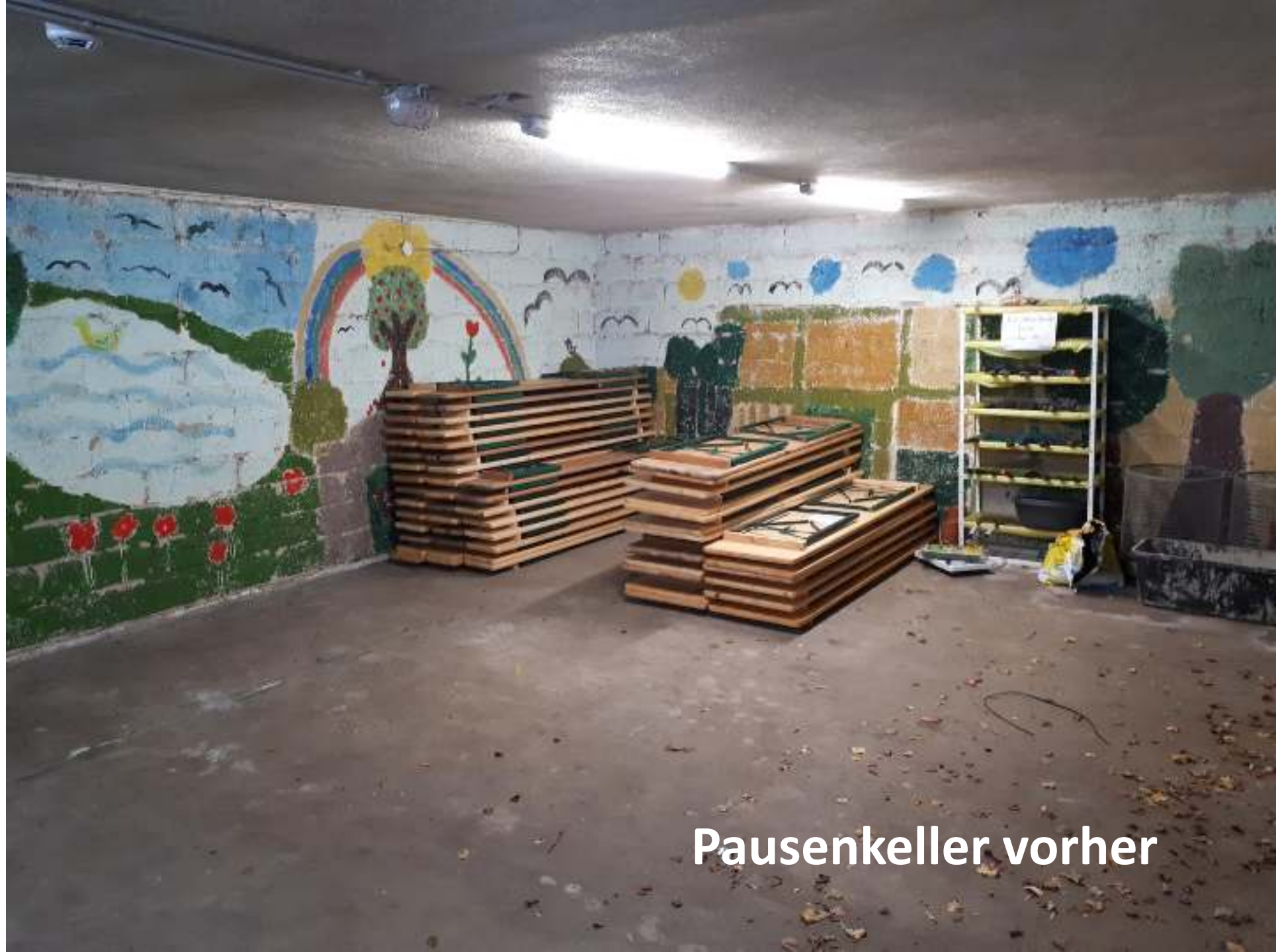
Pausen Keller vorher