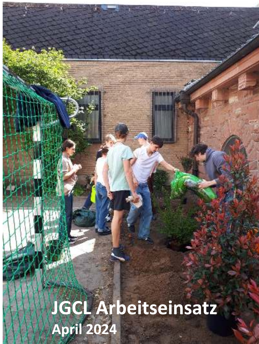
JGCL Arbeitseinsatz April 2024