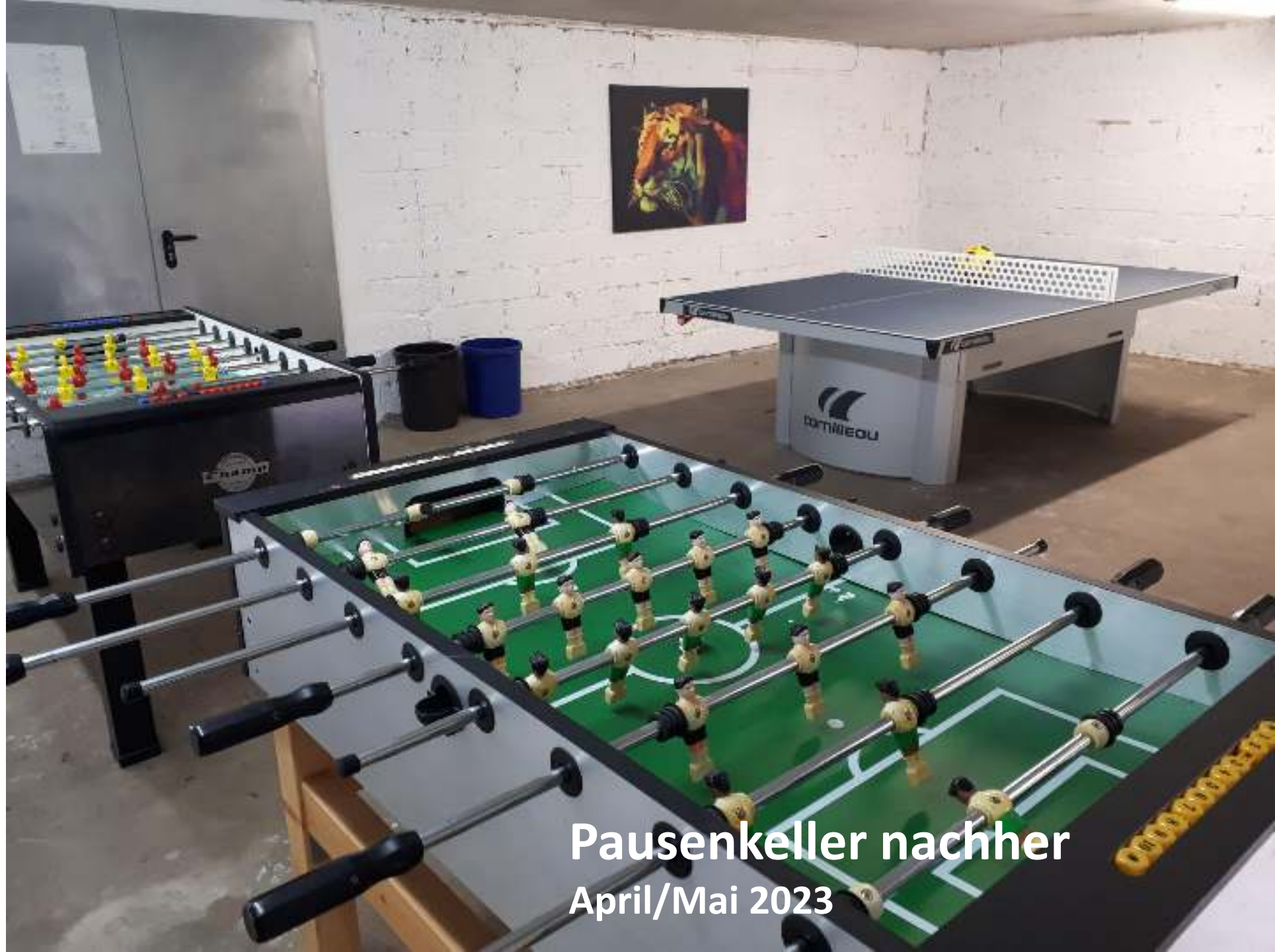
Pausenkeller nachher April/Mai 2023