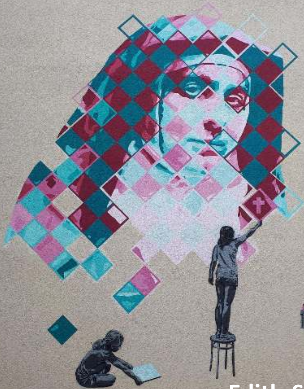
Edith-Stein-Gemälde Sommerferien 2024