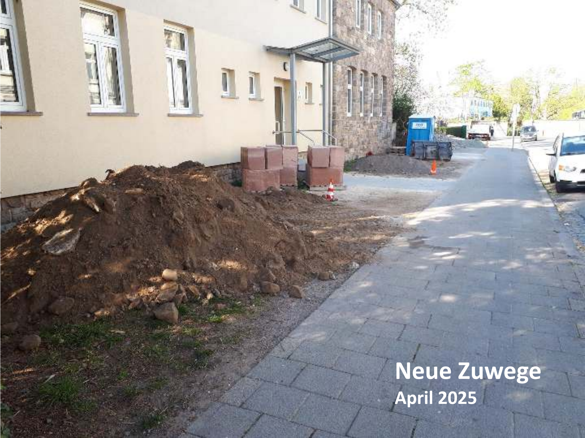
Neue Zuwege April 2025