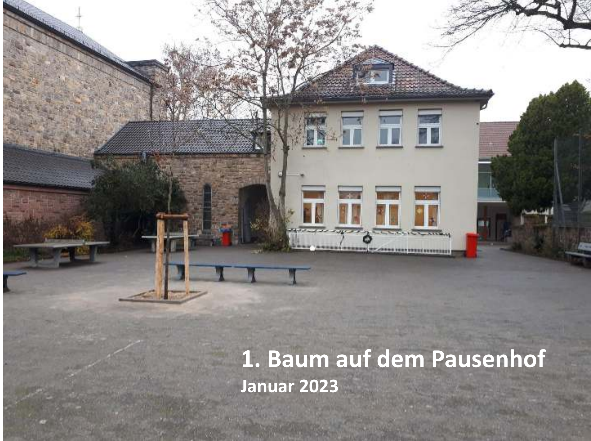
1. Baum auf dem Pausenhof Januar 2023