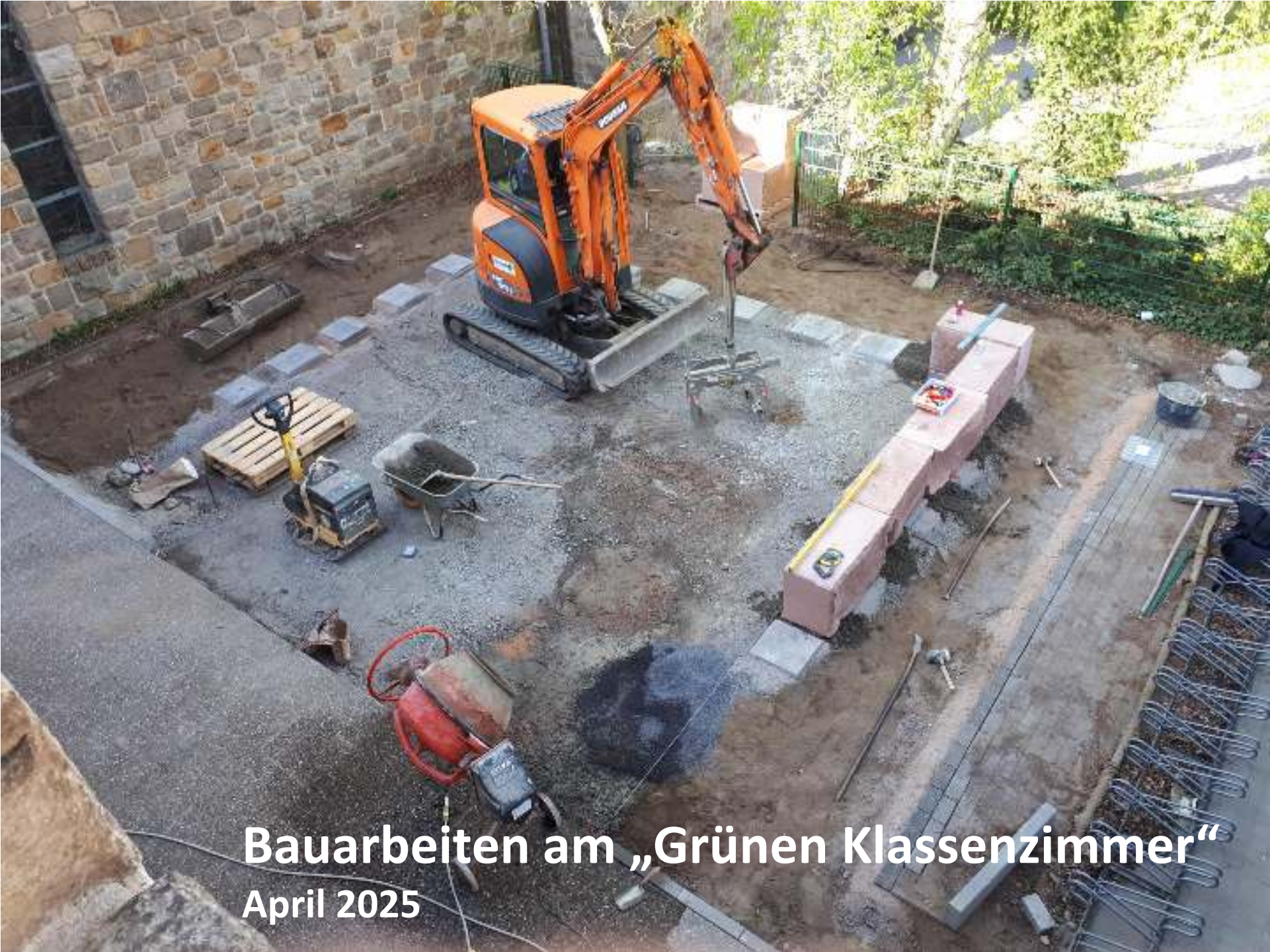
Bauarbeiten am „Grünen Klassenzimmer“ April 2025